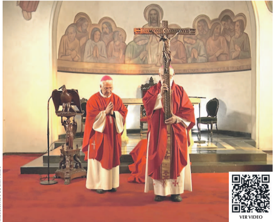
ARZOBISPADO DE SANTIAGO