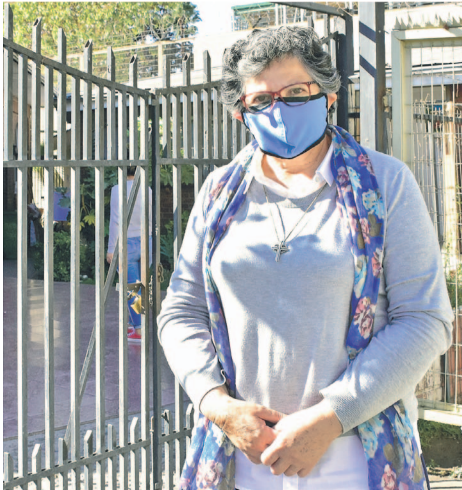
GENDARMERÍA DE CHILE

¿Cuál fue la motivación que la llevó a tomar la decisión de irse a vivir al penal?