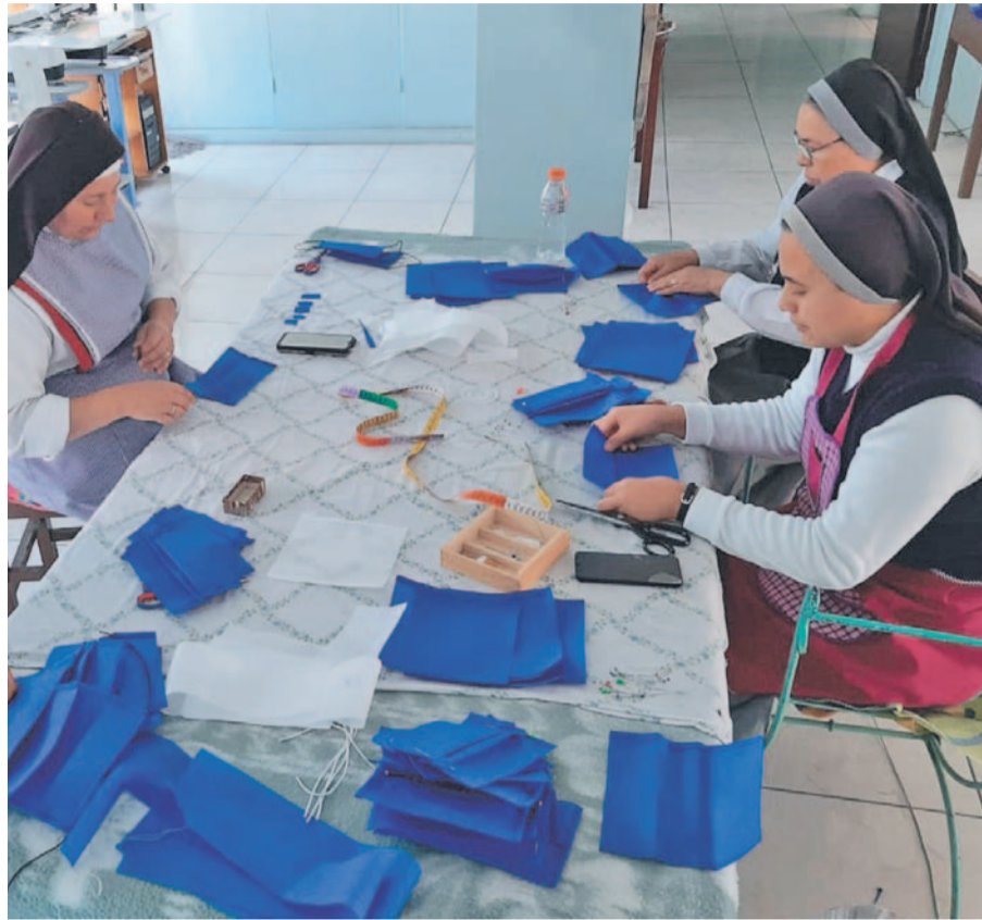
MONASTERIO DE LA ADORACIÓN PERPETUA

Las mascarillas fueron sanitizadas y enviadas para ser esterilizadas nuevamente y poder ser utilizadas por el personal