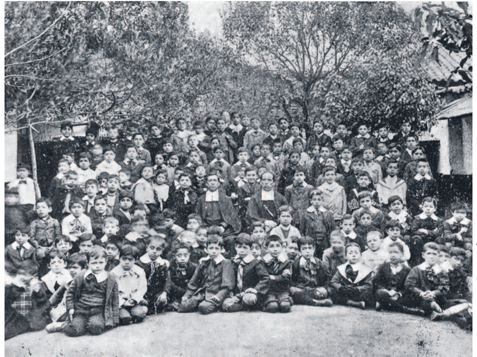
RED EDUCACIONAL SANTO TOMÁS DE AQUINO

Los establecimientos educacionales que actualmente forman la Red son: Liceo Miguel Rafael Prado, comuna de Independencia; Liceo José Domingo Cañas, Quilicura; Liceo San Francisco, San Ramón; Complejo Educacional Monseñor Luis Arturo Pérez, Pedro Aguirre Cerda; Liceo Sara Blinder, Santiago; Colegio Santa Marta, Ñuñoa; Escuela Nuestra Señora del Carmen y Colegio San Alberto Hurtado, ambos en Quilicura. Todos ellos son gratuitos y destacan por su excelencia académica.