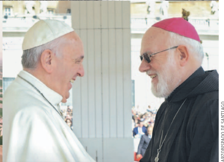
ARZOBISPADO DE SANTIAGO

“Jesucristo nos pide un cambio profundo, lo que llamamos conversión. Los acontecimientos de estos últimos tiempos han sido duros y amargos, se ha mostrado otra cara de nuestra sociedad, ha quedado patente la fuerza destructora del mal y, a la inversa, la fuerza constructora de quienes hacen el bien, aunque sin estridencias ni exhibicionismos”