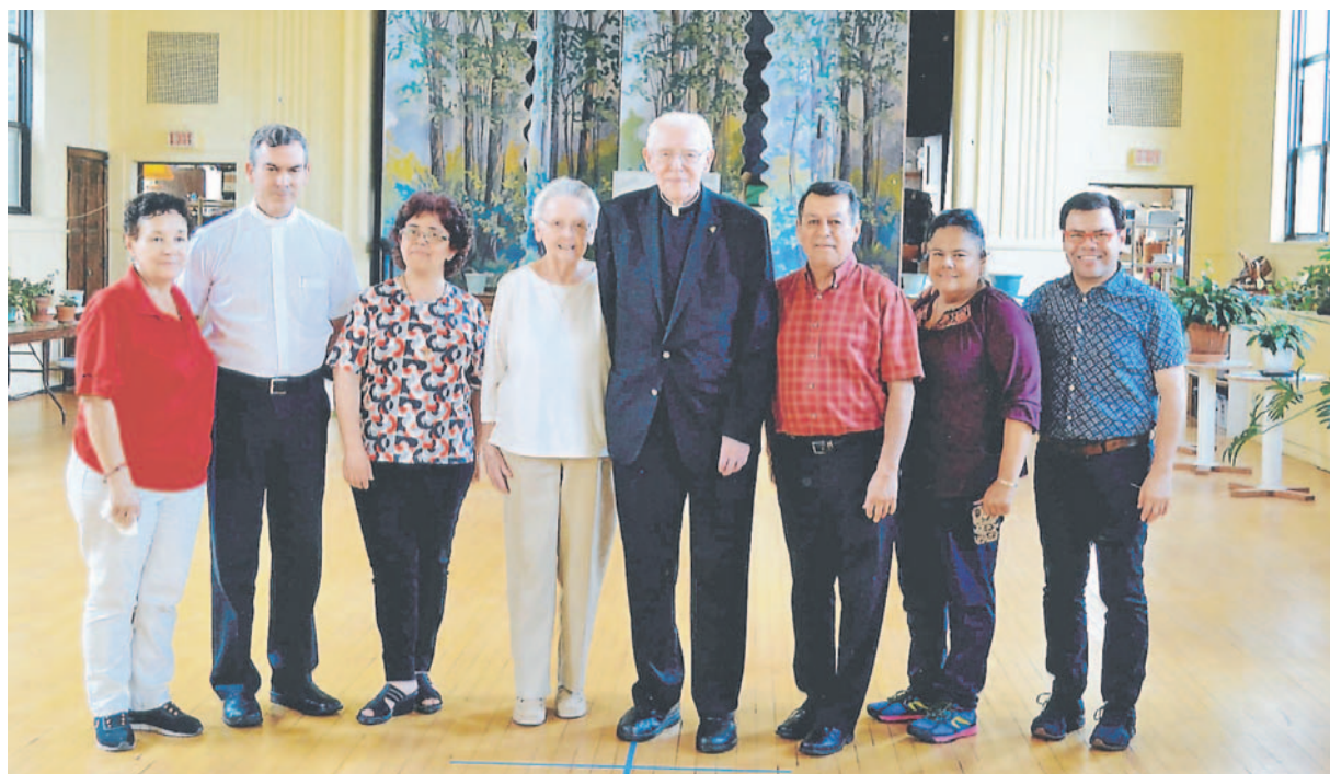
ARZOBISPADO DE SANTIAGO

Integrantes del Departamento de Catequesis del Arzobispado de Santiago viajaron hasta el centro “Spred”, en Chicago, para realizar una intensiva capacitación en Educación Religiosa Especial. La formación permitirá implementar en la Iglesia de Santiago una renovada metodología pastoral de evangelización a personas en situación de discapacidad.